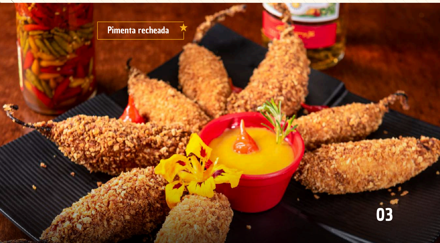
Pimenta recheada ★