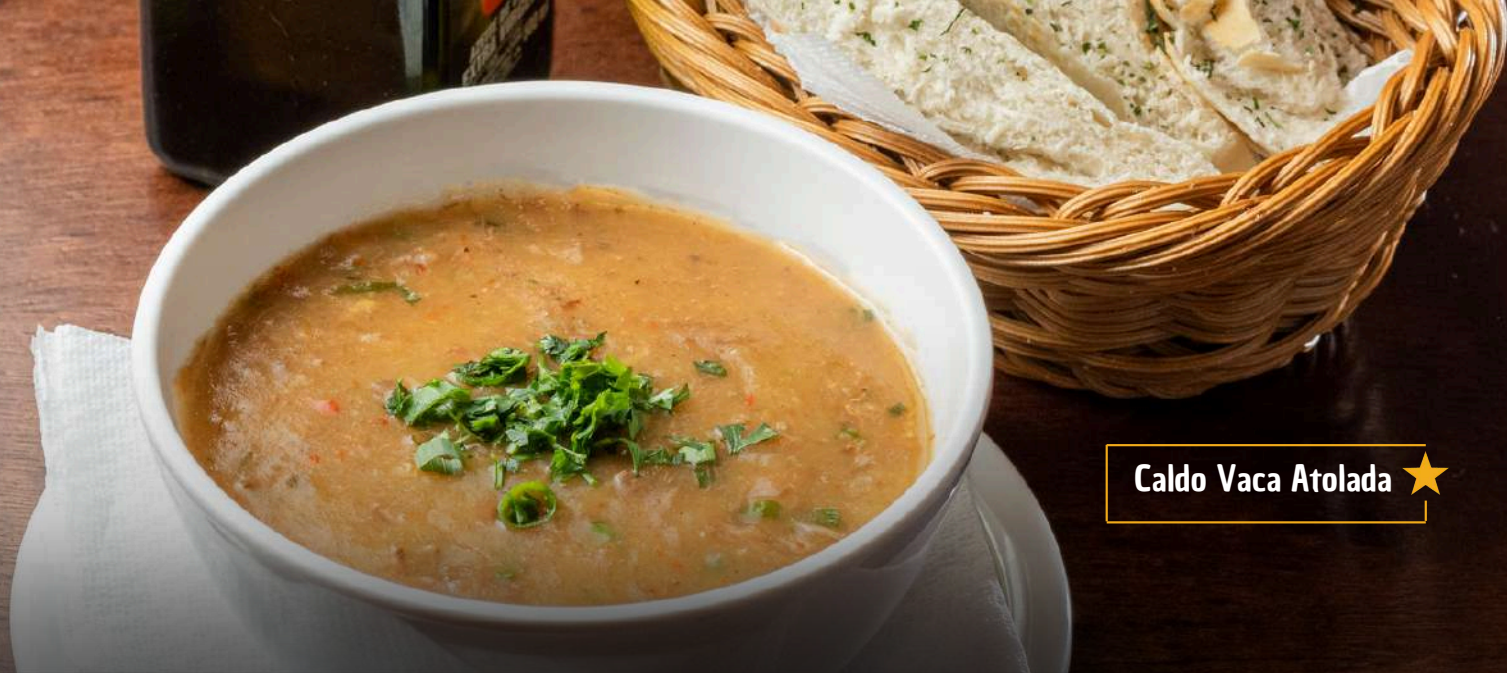
Caldo Vaca Atolada ★