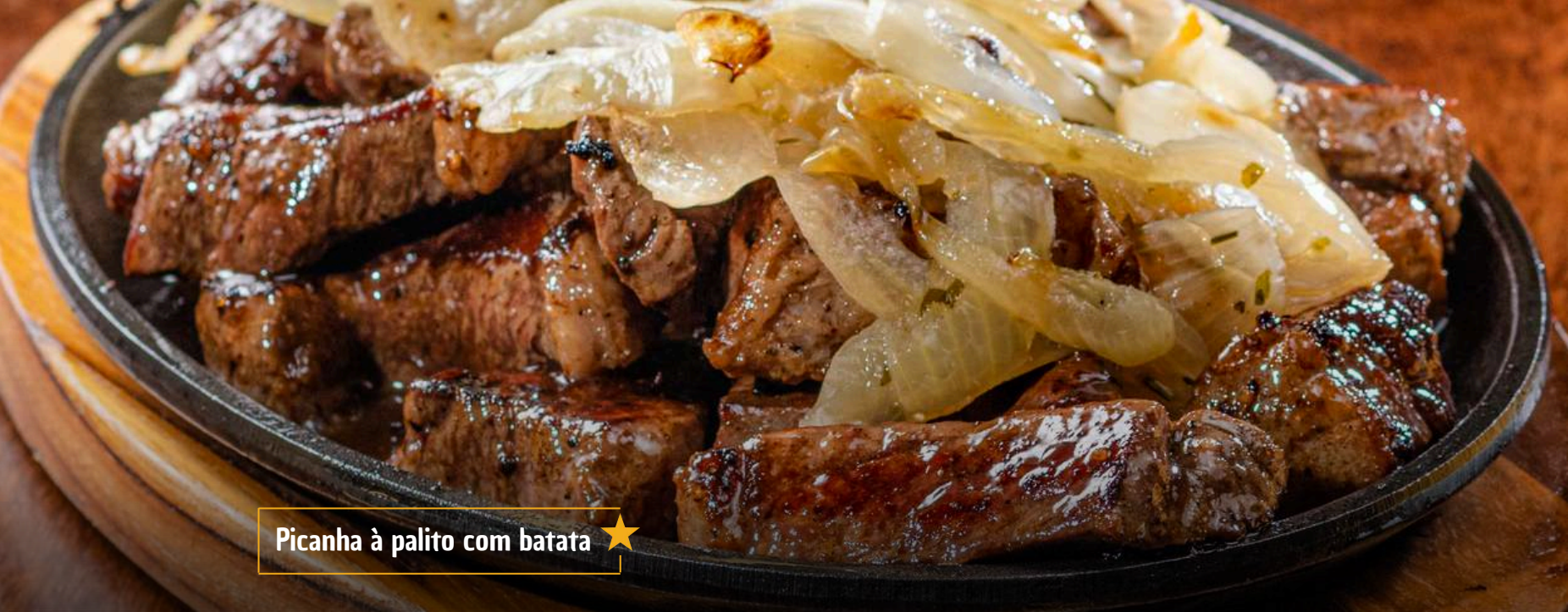
Picanha à palito com batata ★