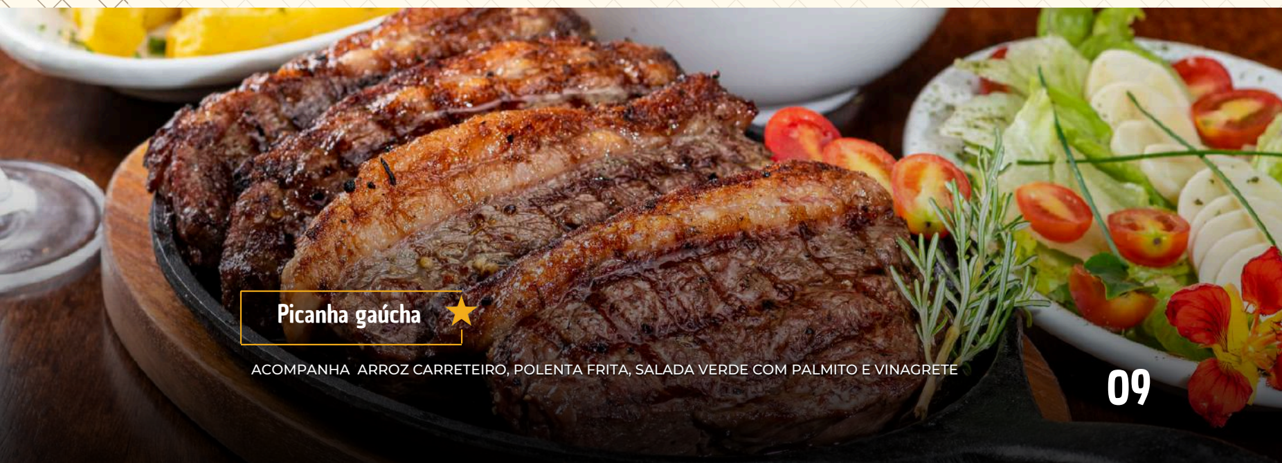
Picanha gaúcha ★

ACOMPANHA ARROZ CARRETEIRO, POLENTA FRITA, SALADA VERDE COM PALMITO E VINAGRETE